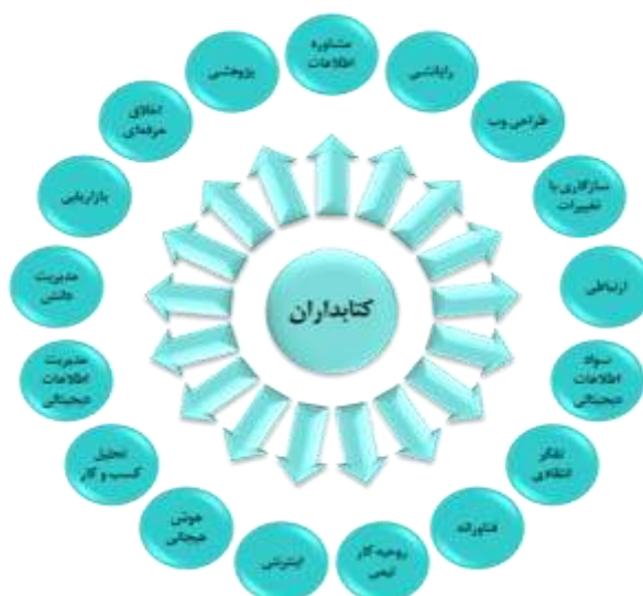
تصویر ۲. صلاحیت‌ها و مهارت‌های کتابداران و متخصصان علم اطلاعات در آینده

اطلاعات در آینده انجام شده است. این مطالعات بیشتر در صدد تبیین نقش و جایگاه کتابداران در کتابخانه‌های آینده؛ شناسایی صلاحیت‌های اصلی کتابداران در آینده؛ پیش‌بینی مهارت‌های کتابداران دیجیتال؛ تحولات نقش کتابداران و راهکارهای حفظ جایگاه متخصصان علم اطلاعات با ظهور فناوری‌های هوشمند در آینده بودند. مهمترین نقش‌ها و مسئولیت‌هایی که در این مطالعات برای کتابداران آینده مورد اشاره قرار گرفتند، در تصویر ۲ نشان داده شده است.