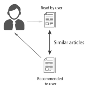
تصویر ۱. مدل پالایش مبتنی بر محتوا ۳