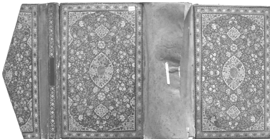
تصویر ۱۱. تک جلد یک کتاب (نامعلوم)، روغنی سرطبل‌دار ترنج و سرترنج منقوش به گل و برگ، ۱۵/۵×۲۴/۵ سانتی‌متر، احتمالاً قاجاری، موزه قرآن و کتابت مسجد صاحب‌الامر تبریز

دفتین داخل جلد نیز با فن روغنی و نقش گل‌های مختلف در قالب یک تقسیم‌بندی هندسی به صورت شطرنجی و مکرر بر زمینه قرمز و حاشیه‌ای با نقش گل و برگ ظریف زرد و قرمز بر زمینه سیاه، تزیین گردیده است.