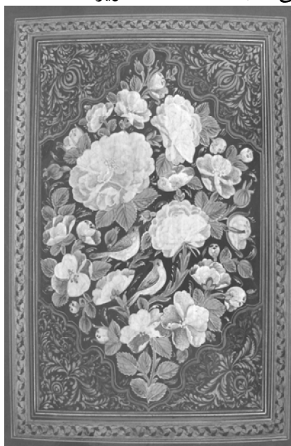
تصویر ۸. تک جلد یک کتاب (نامعلوم)، روغنی و نقش گل و مرغ و حاشیه مذهب، ۲۳/۵×۱۷/۵ سانتی متر، احتمالاً قاجاری، موزه قرآن و کتابت مسجد صاحب‌الامر تبریز

روغنی ممتاز و نقش گل و مرغ ظریف در میان و چهار لچک و حاشیه‌ای مذهب بر زمینه قهوه‌ای، به زیبایی کار شده است. (تصویر ۸)