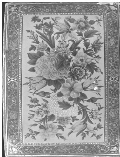
تصویر ۱. جلد کتاب زاد المعاد، روغنی و نقش گل و برگ و حاشیه گل و برگ، ۱۴/۵×۲۳/۵ سانتی‌متر، کار استاد محمد علی، کتابت شده به خط نسخ توسط محمد حسین تبریزی، ۱۲۴۵ ه.ق.، موزه قرآن و کتابت مسجد صاحب الامر تبریز

«این جلد منقش که بود زاد معاد کز فاضل مجلسی بود روحش شاد نقشش از محمد علی آن مانی عصر در دولت بهمن شاه با دانش و داد»