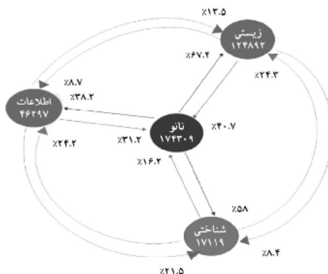
شکل ۱. شبکه ارتباطی چهار حوزه نانو، اطلاعات و شناختی بر اساس همکاری علمی قوی‌ترین ارتباط و هم‌پوشانی

ارتباطات و هم‌پوشانی این چهار حوزه، شبکه موجود در تصویر را از چند زاویه دیگر نیز می‌توان مورد بررسی قرار داد.