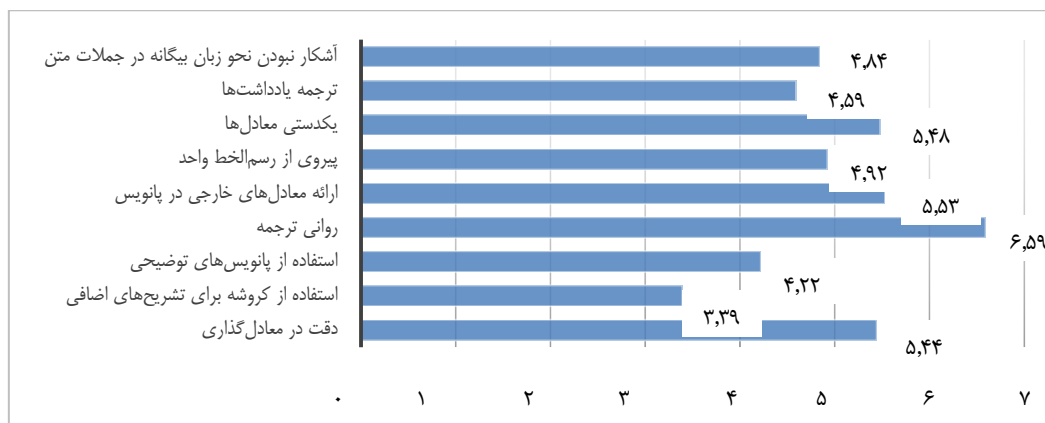
نمودار ۴. میانگین رتبه هر معیار در مؤلفه محتوای ترجمه‌ای

طبق داده‌های جدول ۴ در باب مؤلفه محتوای تألیفی، «نبود جانب‌داری و تعصب» از دیدگاه صاحب‌نظران در شاخص محتوای تألیفی از اهمیت بالایی برخوردار است. پس از آن، به ترتیب اولویت، «تازگی مطالب ارائه‌شده (بدیع بودن مطالب)»، «بررسی منصفانه دیدگاه مخالف و موافق»، «روزآمد بودن» و «جذابیت محتوا در حوزه موضوعی» قرار دارند. «دست‌سوم بودن منبع (گزارشی توصیفی بر پایه منابع دست‌اول و دوم در مورد مسئله‌ای خاص)» و «وجود تقریظ» کمترین اهمیت را در شاخص محتوای تألیفی دارند.