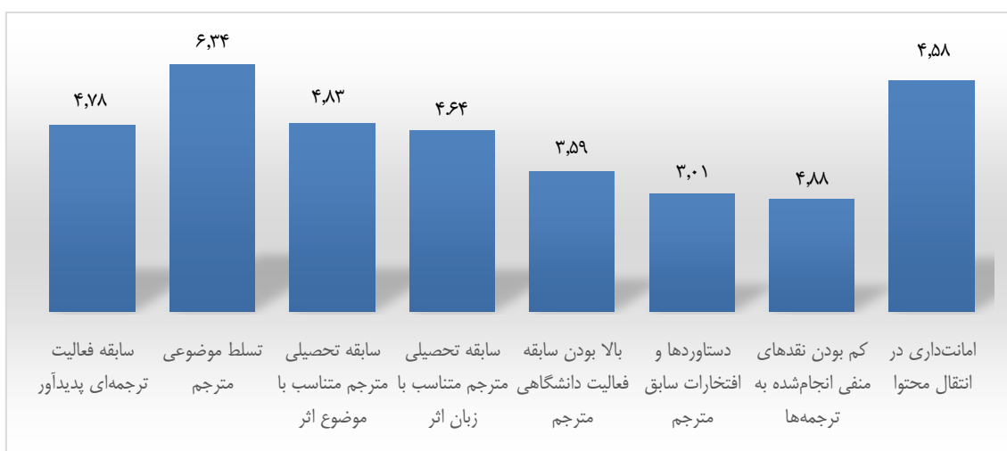
نمودار ۳. میانگین رتبه هر معیار در مؤلفه مترجم

طبق نتایج نمودار ۲ در مؤلفه پدیدآور، «تسلط موضوعی پدیدآور متناسب با اثر» بالاترین رتبه را در رابطه با شاخص پدیدآور از دیدگاه صاحب‌نظران به خود اختصاص داده است. پس از آن، به ترتیب اولویت، «امانت‌داری در استناد»، «سابقه تحصیلی پدیدآور متناسب با موضوع اثر»، «بالا بودن استنادات به آثار پدیدآور» و «سابقه فعالیت پژوهشی پدیدآور» قرار دارند. «وابستگی سازمانی پدیدآور (سازمان‌های تجاری، صنعتی)» و «بالا بودن سابقه اجرایی پدیدآور متناسب با موضوع اثر» از دیدگاه صاحب‌نظران نیز به ترتیب از کمترین اهمیت در شاخص پدیدآور محسوب می‌شوند.