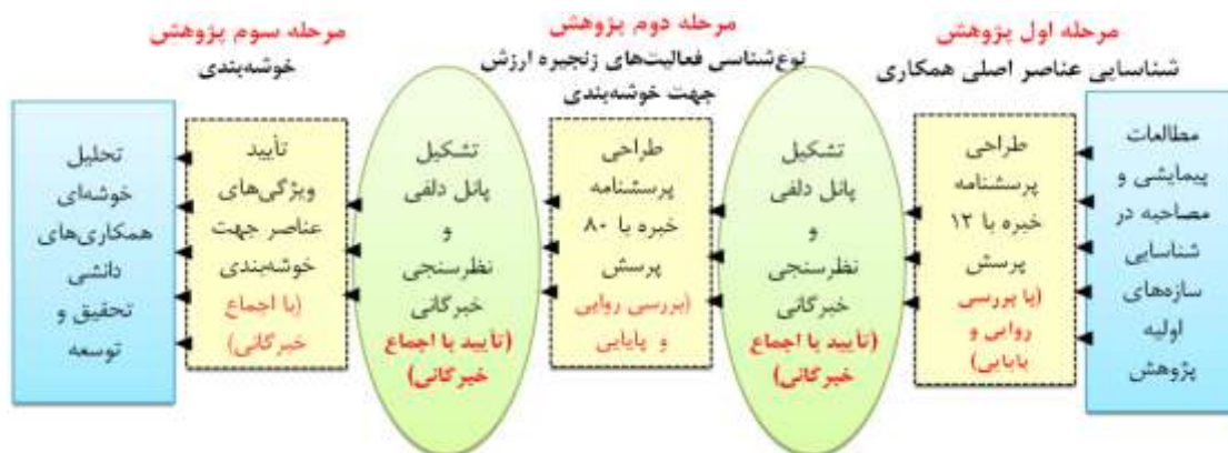
شکل ۲. الگوی مفهومی فرآیند انجام پژوهش

گام نخست پژوهش، واکاوی و بررسی موضوع جهت نوع‌شناسی مناسب همکاری‌های دانشی با مروری بر پیشینه‌ها و بررسی‌های پیمایشی است. بر اساس جستجوهای انجام شده، ۵۶ منبع مرتبط با حوزه همکاری‌های دانشی به شرح شکل ۳ شناسایی و بر مبنای بررسی‌های آن‌ها، طراحی پرسش‌های اولیه مصاحبه‌ها و طراحی پرسشنامه‌ها در روش دلفی صورت پذیرفته است.