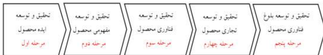
شکل ۱. ساختار ساده زنجیره ارزش تحقیق و توسعه (ملونی و دیگران، ۱۳۹۹، ص. ۲۱)

مرحله تحقیق و توسعه بلوغ فناوری، در قالب دو زیرمرحله با عنوان‌های «توسعه کارکرد در فرآیند تولید» و «پشتیبانی و مدیریت بلوغ فناوری» از فرآیند توسعه دانش فنی، تا تنوع بخشی به محصول و ساخت محصولات مکمل محصول اصلی را پوشش می‌دهد.