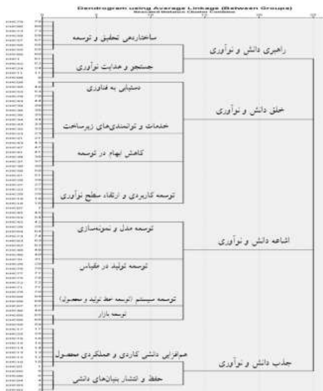
شکل ۴. نمودار درختی خوشه همکاری‌های دانشی زنجیره ارزش تحقیق و توسعه

تمام مراحل خوشه‌بندی را می‌توان به طور مختصر در نمودار درختی نشان داد، هر برگ این درخت یک نوع مختلف از مسائل رده‌بندی را مطرح می‌کند (زجاجی و دلداری، ۱۳۸۷). شکل ۴ نمودار درختی، نتایج تحلیل خوشه‌ای را برای ابعاد همکاری‌های دانشی تحقیق و توسعه، در قالب ۴ خوشه نشان می‌دهد که در نهایت برگ‌های این درخت، ۸۰ نوع فعالیت زنجیره ارزش تحقیق و توسعه را پوشش می‌دهند.