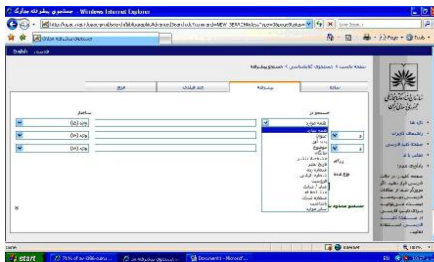
تصویر ۲. جستجوی پیشرفته در رابط کاربری نرم افزار رسا