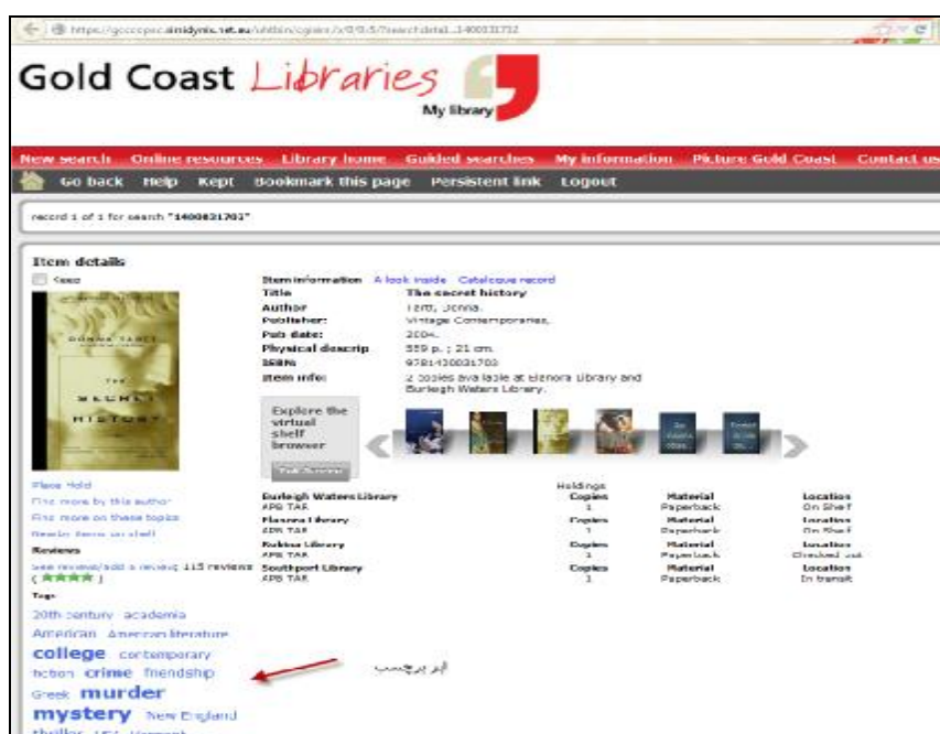
تصویر ۳: نمایش ابربرچسب با تمایز در اندازه در یک اپک کتابخانه

193). مهم‌ترین مرکز ارائه خدمات برچسب‌دهی به کتابخانه‌ها، library Thing است که این قابلیت را به شکل یک ویژگی سفارشی به اپک‌های کتابخانه‌ای اضافه می‌کند. بر این اساس، یک قابلیت جستجوی جدید بر مبنای برچسب‌های داده شده به منابع به اپک‌ها اضافه می‌شود که به غنای بیش‌تر فهرست‌ها کمک می‌کند. بر اساس آخرین آمار موجود، بیش از ۴۰۰ کتابخانه در سراسر دنیا از خدمات برچسب‌گذاری در اپک‌های خود استفاده می‌کنند (Library Thing, 2012). نمونه‌هایی از اپک‌های کتابخانه‌ای که از قابلیت برچسب‌گذاری استفاده می‌کنند و تفاوت نحوه نمایش برچسب‌ها در آنها در تصاویر ۳ و ۴ قابل مشاهده است.