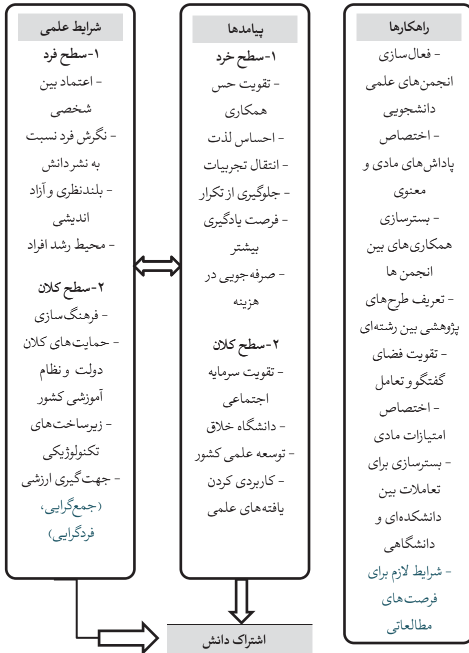
شکل ۲. مدل تحلیلی شرایط علمی؛ راهکارها و پیامدها