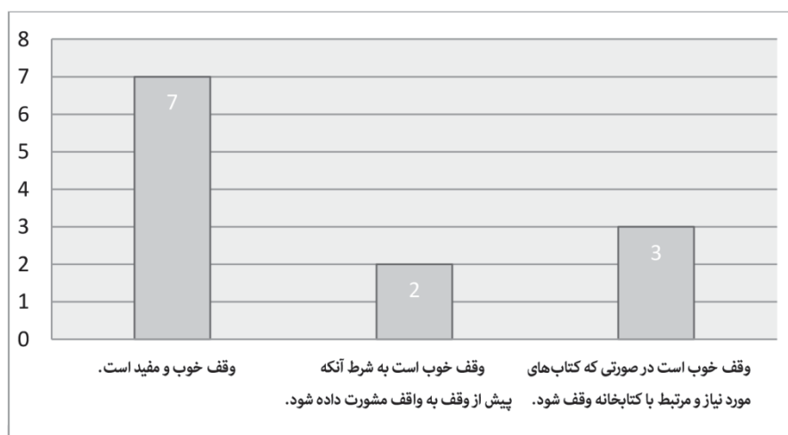
نمودار ۱. رویکرد کتابخانه‌های اسلامی نسبت به منابع وقفی

عملی خوب و مفید برای حیات کتابخانه می‌دانند. با وجود این، برخی از مدیران وقف کتاب را در صورت وجود شرایطی، مفید می‌دانند. براین اساس، مدیران سه کتابخانه وقف را در صورتی که کتاب‌های مورد نیاز و مرتبط با موضوع کتابخانه وقف شود، مفید می‌دانند. همچنین دو مدیر، وقف را در صورتی مفید می‌دانند که واقف پیش از وقف با صاحب‌نظران مشورت کند.