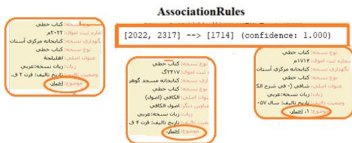
شکل ۴. نمایی از قوانین ایجاد شده و مطابقت آن با موضوع اخبار

در این قسمت می‌توان به نتایجی که از تطبیق میان شماره‌های ثبت در قوانین ایجاد با موضوعات منابع (نسخ خطی) به وجود آمده است چنین تفسیر نمود: