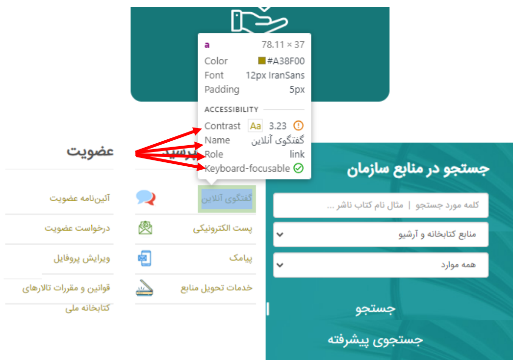
شکل ۱. نام، وضعیت، نقش، کنتراست رنگ و درک هر گزینه با فناوری کمکی با مشاهده منبع کدها

همان‌طور که در شکل ۱ دیده می‌شود، در مورد کنتراست گزینه «گفتگوی همزمان» (۳/۲۳)، وضعیت کاملاً مطلوب نیست و «تا حدودی» از کنتراست مطلوب برخوردار است (در متون بر کنتراست مطلوب بیش از ۴ و ۵ اشاره شده است). در چنین مواردی گزینه «تا حدودی بله» مبنای قرار گرفته است. در جدول ۲ میزان دسترس‌پذیری وبگاه‌های کتابخانه‌ای مورد مطالعه (۷ رابط کاربری) بر اساس شاخص‌های استخراجی کنسرسیوم وب جهانگستر در دو اولویت A و AA ارائه شده است: